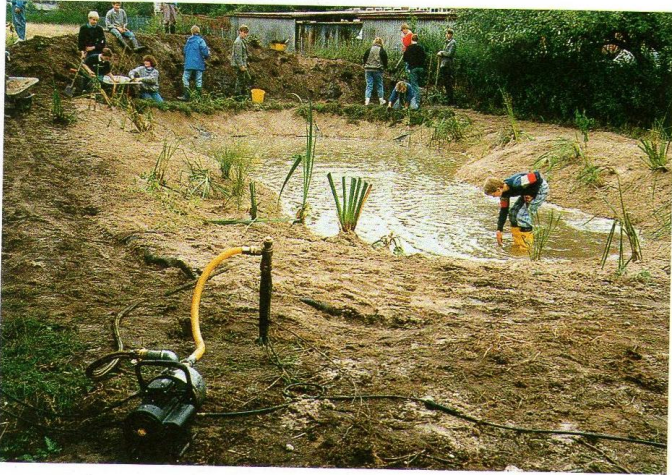
66.1 Schüler legen ein Biotop an.

Wie wir heute mit unserer Umwelt umgehen, macht sich in der Zukunft bemerkbar. Deshalb müssen wir schon heute überlegen, was jeder von uns tun kann, um die Natur zu schützen und die begrenzten Ressourcen zu schonen.