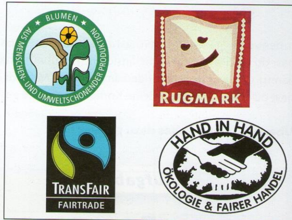
71.1 Verschiedene Zeichen für umweltgerecht produzierte und/oder fair gehandelte Produkte

Um den Menschen in den Entwicklungsländern zu helfen, können wir Produkte kaufen, die unter fairen Bedingungen gehandelt werden.