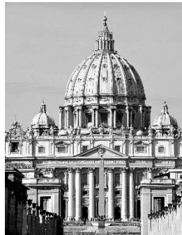
Petersdom in Rom

Ich wünsche euch viel Spaß beim Arbeiten und bleibt gesund!