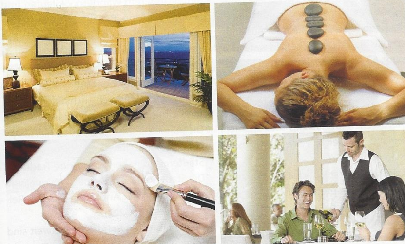
M4 Werbung eines Wellnesshotels heute