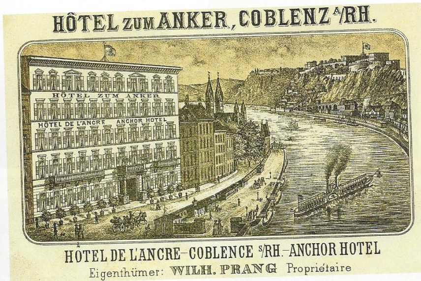
M3 Werbung des Hotels „Zum Anker“ in Koblenz um 1860