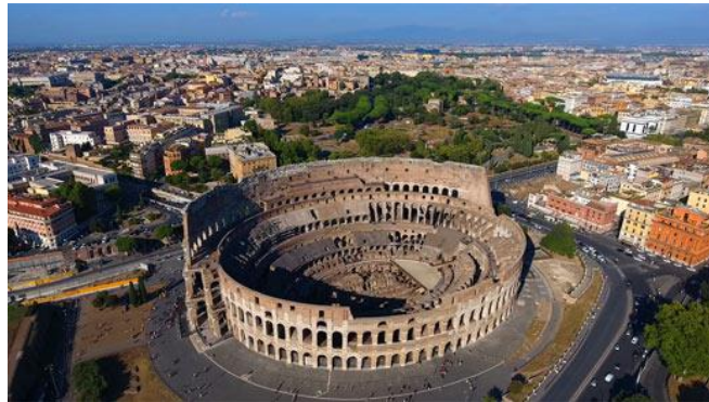
Das Kolosseum (früher und heute)