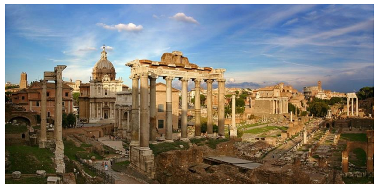
Das Forum Romanum (früher und heute)